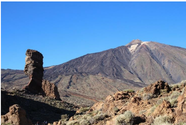
Nationalpark El Teide

Am Rand dieses beeindruckenden Kratergebiets thront das Wahrzeichen Teneriffas, der Vulkan Teide . Im Inneren des Kraters erkunden Sie die markanten Felsformationen Los Roques.