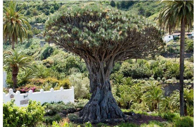
Drachenbaum Drago Milenario CC0 pixabay

Weiter geht es zum Aussichtspunkt Mirador de Garachico . Bei einer kurzen Kaffeepause genießen Sie die schöne Aussicht.