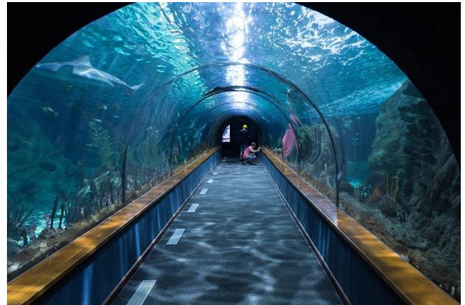
Haifischtunnel im Loro Parque