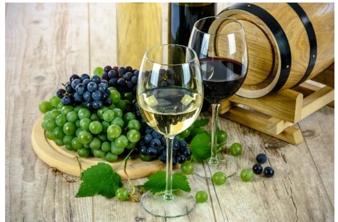
Weinverkostung in einer Bodega

Zum fabelhaften Abschluss Ihrer eindrucksvollen Reise gibt es einen kulinarischen Höhepunkt im Steakhouse Brunelli's , bekannt für das beste Fleisch diesseits des Atlantiks. Im einzigartigen Southbend Grill wird das Fleisch auf 800°C erhitzt und erreicht somit eine perfekte Karamellisierung; außen knusprig und innen saftig. Direkt am Atlantik genießen Sie als Abschlussessen der Reise ein mehrgängiges Menü mit Blick aufs Meer und einem beeindruckenden Sonnenuntergang.