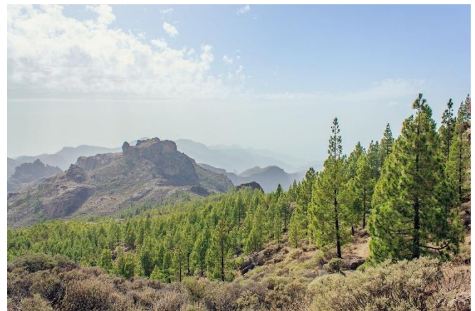
Panoramaaussicht auf Gran Canaria

Nach dem Frühstück erwartet Sie ein Tagesausflug auf die Insel Gran Canaria, deren Spitzname auch der „ Miniaturkontinent “ ist. Sie werden vom Hotel abgeholt und fahren mit der Fähre auf die Nachbarinsel. Auf der drittgrößten Insel der Kanaren angekommen, erwartet Sie eine Rundfahrt begleitet von einem Reiseleiter. Sie lernen eine der schönsten historischen Altstädte der Kanaren kennen, das Viertel Vegueta .