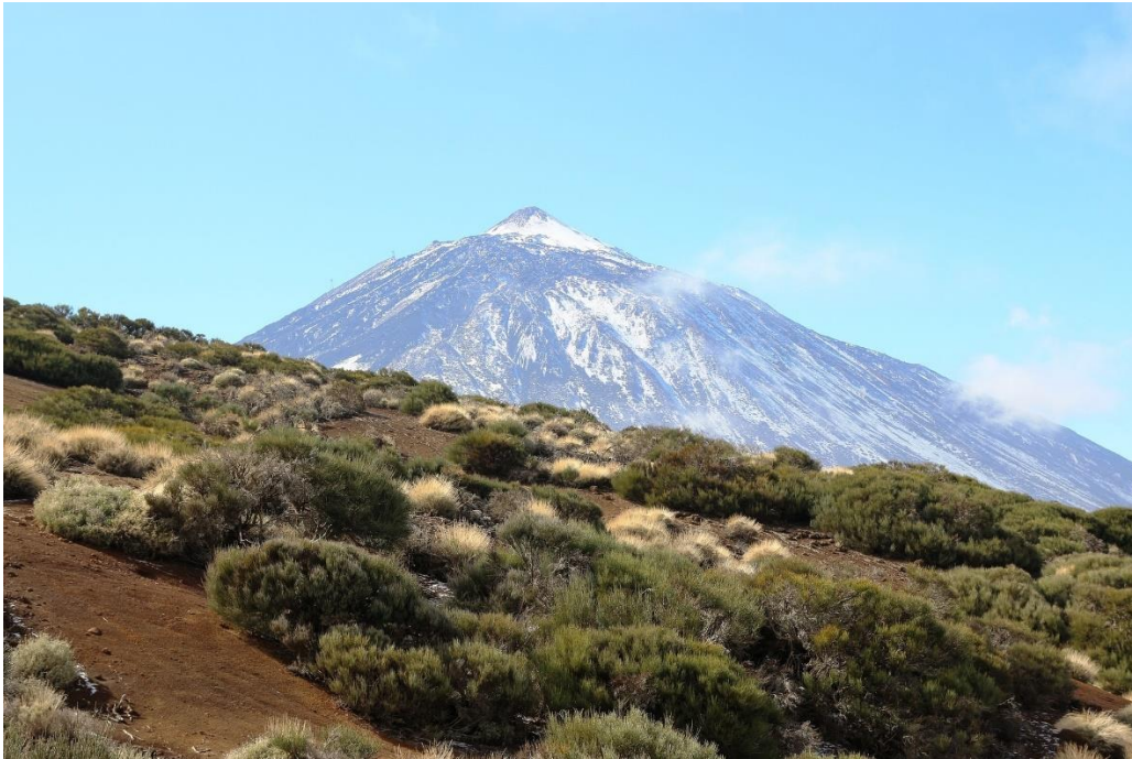
Panoramaaussicht auf den Teide

Lassen Sie sich verzaubern von der Insel des ewigen Frühlings – Teneriffa. Der Fokus dieser Reise liegt auf dem atemberaubenden Loro Parque , der mehrfach zum besten Zoo der Welt gewählt wurde. Ein besonderes Highlight stellt der Besuch der Papageien-Aufzuchtstation La Vera der Loro Parque Fundación dar. Eine Besonderheit Ihrer Reise ist auch der tägliche freie Eintritt in den Loro Parque. Lernen Sie den Park in all seinen Facetten kennen. Ein Abstecher auf die Nachbarinsel Gran Canaria mit dem Besuch der Altstadt Vegueta und des Aquariums Poema del Mar geben Ihnen einen Einblick in die Vielfältigkeit der Kanarischen Inseln.