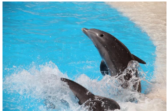
Delfine im Loro Parque

Eine unvergessliche Reise geht zu Ende. Transfer zum Flughafen Teneriffa Süd und Rückflug mit Euro-wings nach Düsseldorf.