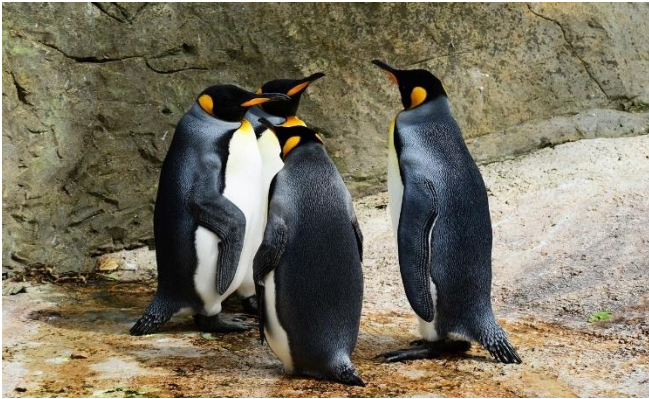
Königspinguine CC0 pixabay

Flug mit Eurowings von Düsseldorf nach Teneriffa Süd. Ein Transfer bringt Sie zu Ihrem 4-Sterne-Standardhotel Precise Resort Tenerife in Los Realejos. Zimmerbezug für die nächsten 6 Nächte. Je nach Flugzeit steht Ihnen der Rest des Tages zur freien Verfügung, um erste Erkundungen zu unternehmen.