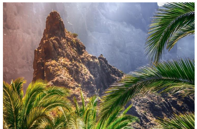
Malerische Masca-Schlucht